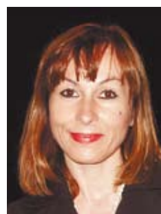
Professor Dr. Anita Rieder

An der KA-Studie beteiligten sich insgesamt 7 000 Frauen im Alter von 16 bis 40 Jahren. In 14 Ländern (Australien, Belgien, Dänemark, Deutschland, Finnland, Frankreich, Holland, Italien, Norwegen, Österreich, Schweden, Spanien, United Kingdom, USA) wurden durchschnittlich je 500 Frauen zu den Kenntnissen über nicht-orale und orale hormonelle Kontrazeptiva und zur Zufriedenheit mit der benutzten Verhütungsmethode befragt. 70 %